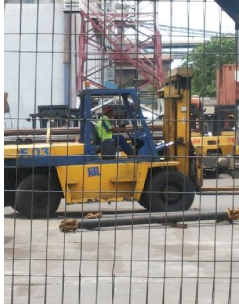
Pekerja yang menggunakan APD